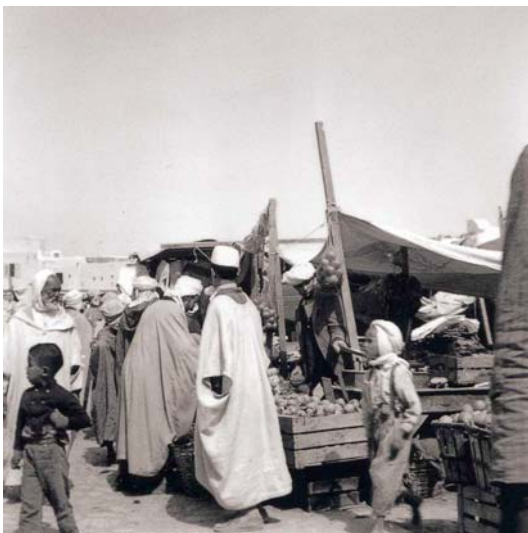
Ghardaïa, Sahara, 1958 - ©Bernard Plossu

Si j'ai toujours beaucoup voyagé, je ne suis pas pour autant un photographe du voyage, de la même façon que je ne suis pas un photographe du flou, ni un photographe du Midi. J'ai horreur de toutes ces étiquettes. Le premier voyage initiatique a eu lieu pour moi à l'âge de treize ans, au Sahara où mon père m'avait emmené, et peut-être que, devenu adulte, je n'ai fait que chercher à