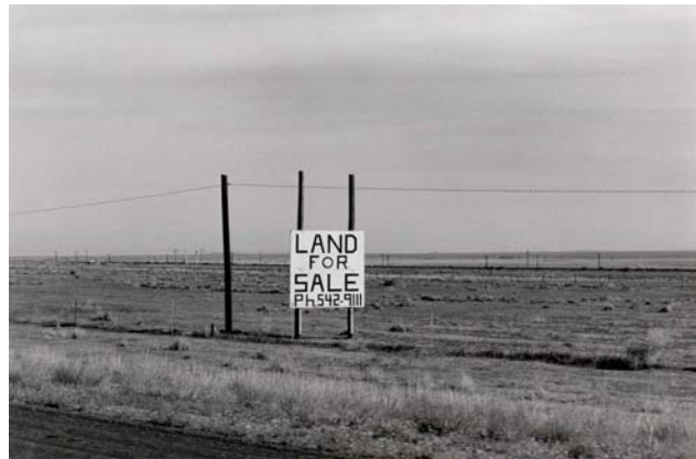
California, 1980 - ©Bernard Plossu

“Ce que j’espère réaliser dans mes photographies est le non-temps, au lieu du temps arrêté. Comme les brefs moments de silence dans la musique du Moyen-Orient. Il ne s’agit pas d’évoquer l’ironie d’un instant, mais de préserver une lourdeur émotive. Un écho plutôt qu’un moment.” Bernard Plossu