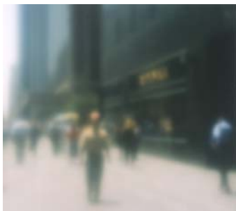
Bill Jacobson - #4033, 2001