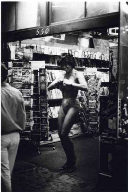
San Francisco, 1982

L'érotisme c'est le mystère. La découverte, c'est la fin de l'érotisme. On est dans une époque où l'on montre tout, et du coup, on ne devine plus rien, donc l'érotisme est mort, il ne reste que la vulgarité. Je n'ai pas besoin de tout montrer pour rêver, au contraire, moins on montre, mieux c'est. C'est un certain regard qui est sensuel, qui est attirant. Dans une rue à Milan j'ai fait quelques photographies d'une femme marchant qui m'a plus séduit que si je l'avais vue nue sur une plage. C'est aussi une question de goût, de bon ou de mauvais goût. Boubat est un photographe très sensuel, sans tomber dans le côté mièvre et romantique du terme.