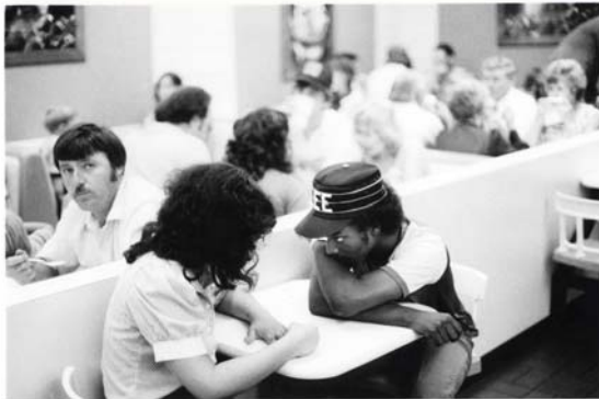
Oklahoma, 1983 - ©Bernard Plossu

Je suis convaincu que la photographie est une forme d'expression littéraire, si elle s'exprime avec