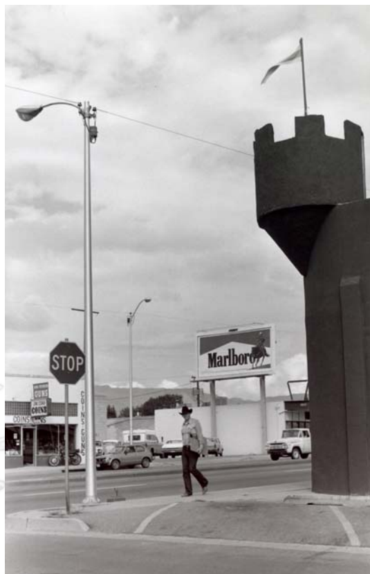
Albuquerque, 1974 - © Bernard Plossu

Frac Haute-Normandie du 20 janvier au 4 mars 2007