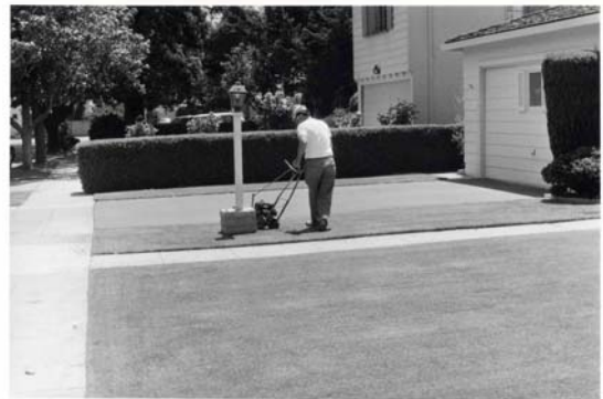
San José, 1974

Quand Bernard Plossu est venu aux États-Unis en 1977, il était déjà reconnu en France comme photographe, ce qui implique qu'il figurait parmi les successeurs désignés de la tradition française du reportage. Plossu est toujours resté fidèle à cette tradition, bien que ses années en Amérique aient modifié sa vision de manière inattendue. Il avait voyagé aux États-Unis plusieurs fois avant d'épouser une Américaine et d'habiter au Nouveau Mexique. Ses premières visites avaient été des missions photographiques, comme ses voyages au Mexique et en Égypte ; une prolongation de l'idéologie du reportage étendu à des sujets exotiques. Si les cultures homogènes du Tiers-monde intriguaient l'Européen cosmopolite, il semble qu'il ait aussi été très attiré par la banalité et l'aliénation de la vie contemporaine en Amérique.