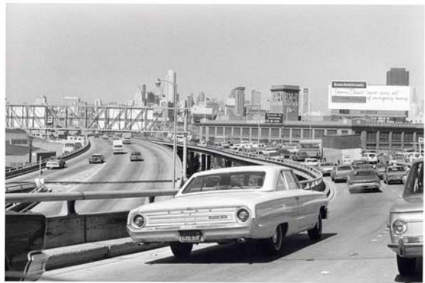
San Francisco. 1974

Malgré sa culture, son intelligence, Plossu photographe tire plus de son expérience directe que d'une stratégie ou de théorie. S'il y a une explication rationnelle à l'affinité qu'il