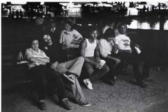
Arizona, 1979

"Rien ne peut être plus abstrait que ce que nous voyons réellement." Giorgio Morandi