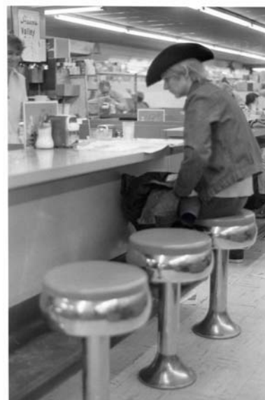
Albuquerque, 1973

À l'heure où l'on redécouvre les grands maîtres de la photographie américaine comme Robert Adams, William Eggleston, Lee Friedlander, Stephen Shore ou Garry Winogrand, il nous a semblé particulièrement judicieux de présenter, sur ce même territoire et durant les mêmes années, le regard d'une des figures majeures de la photographie française, Bernard Plossu. Et cela non seulement parce qu'il a réalisé en Amérique, jusqu'en 1985, une très grande partie de son œuvre, mais parce qu'il a même été considéré à un moment donné, de par sa participation active à la scène artistique de l'époque, comme photographe américain à part entière.