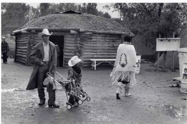
Albuquerque, 1973

Il est vrai que j'ai plutôt témoigné d'une vision pacifique du monde. Ce qui n'empêche qu'un