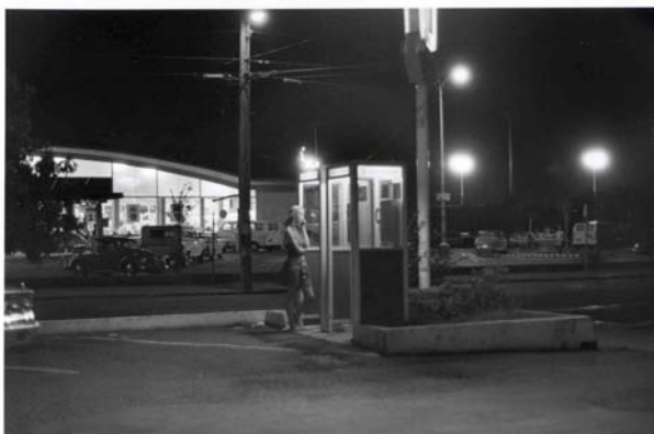
California, 1974

"Je crois que l'écriture est ce qui se rapproche le plus de ma façon de photographier. Je prends des notes sur tout ce que je vois, ce qui est un excellent complément à la prise de vue. D'ailleurs, la photographie c'est cela : prendre des notes. Le pire qu'on puisse dire à propos de la photographie, c'est que c'est de la peinture. Muni d'un équipement léger, comme le 35 mm et en prenant des instantanés, on peut dire qu'on est équipé pour capter des notes. Mon appareil photo n'est pas un pinceau, mais un stylo. Parfois, je me demande si je suis un photjournaliste, ou un écrivain muni d'un appareil." Bernard Plossu